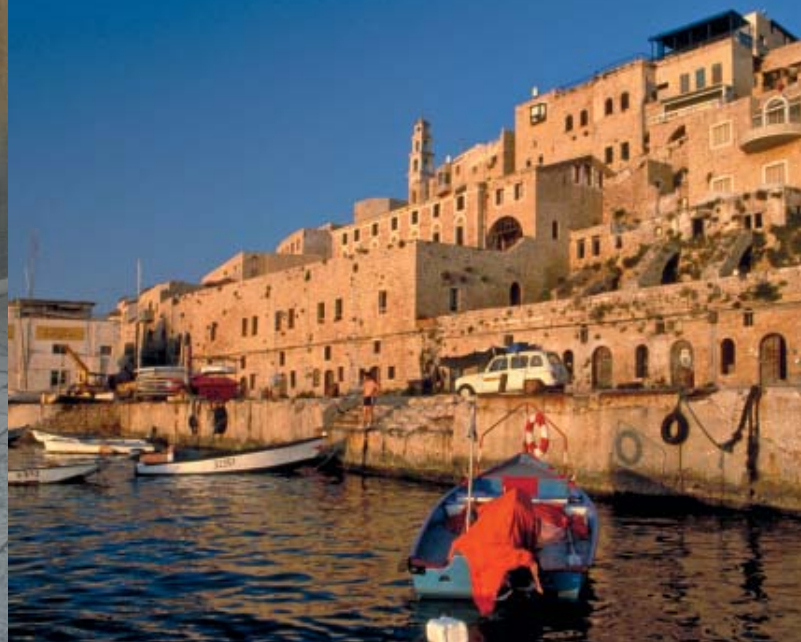
Alle Bilder dieses Folders sind urheberrechtlich geschützt.

dantal geht es weiter nach Galiläa. Hier zeigt sich die Natur in ihrer schönsten Vielfalt. Unzählige Quellen verwandeln das Land in saftiges Grün und ein Meer von Blüten und Heilkräutern. Fast jeder Stein scheint die biblische Geschichte widerzuspiegeln, denn dies ist die Landschaft, in der Jesus lebte, wirkte und predigte.